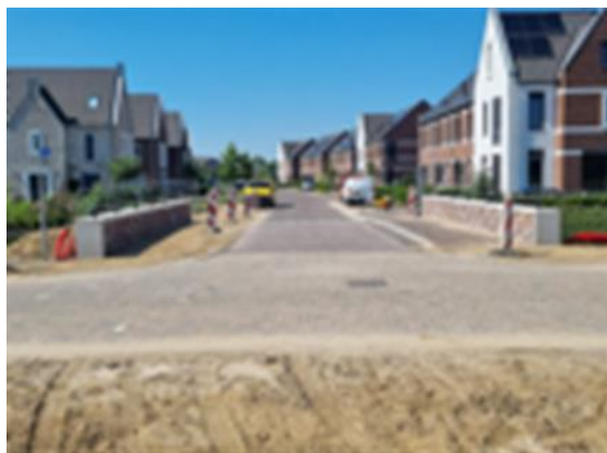
Aannemingsbedrijf Platenkamp 2024-2

* Conform CO 2 -prestatieladder, volgens SKAO (versie 3.1)